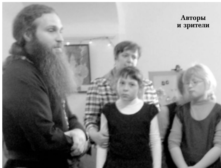
Авторы и зрители