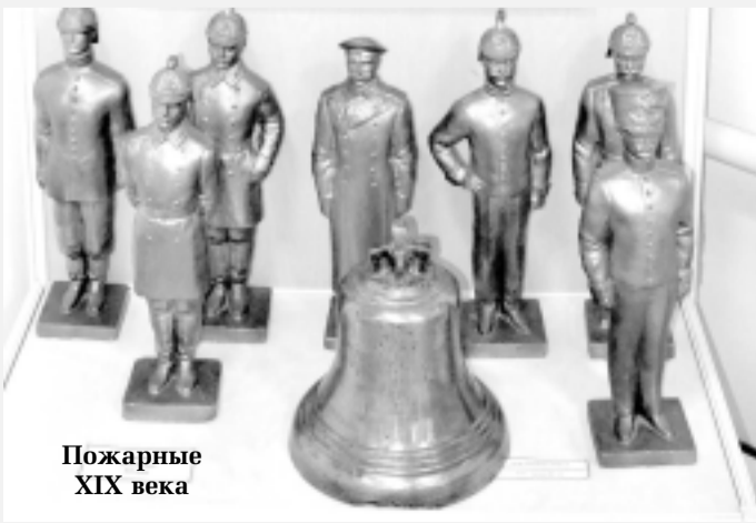
Пожарные XIX века