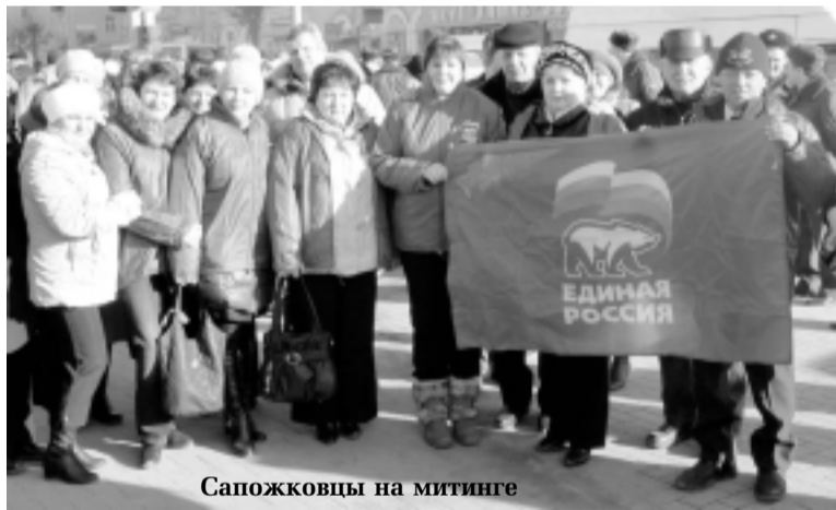
Сапожковцы на митинге

В воскресенье, 16 марта, в АР Крым состоялся референдум. В нем приняли участие более 80 процентов избирателей. По данным на утро понедельника, за вхождение Крыма в состав Российской Федерации проголосовало 96,6 принявших участие в референдуме граждан.