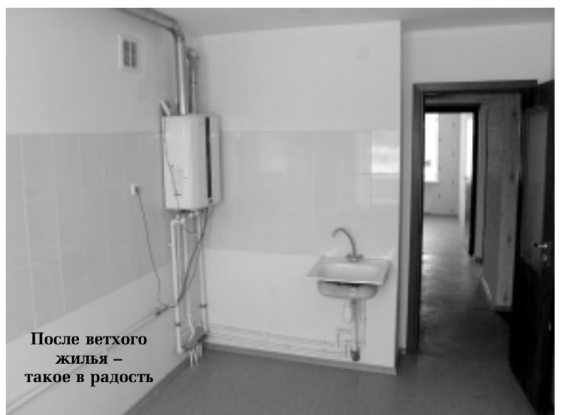
После ветхого жилья – такое в радость