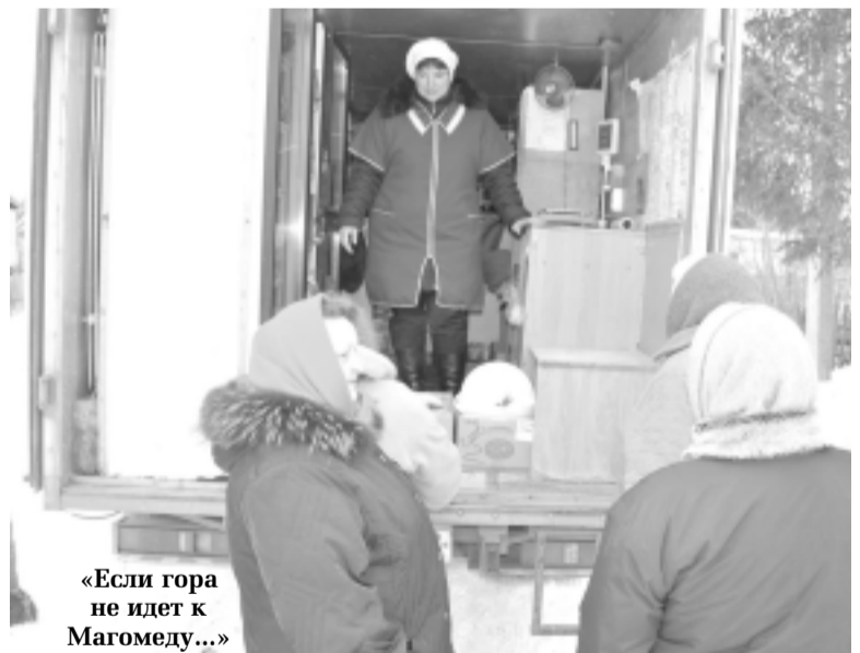
«Если гора не идет к Магомету...»