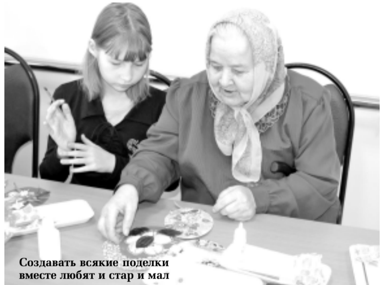
Создавать всякие поделки вместе любят и стар и мал