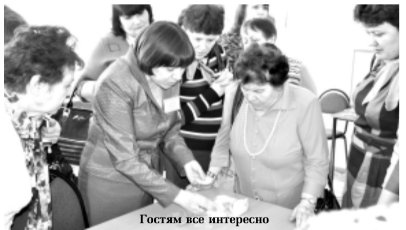
Гостям все интересно