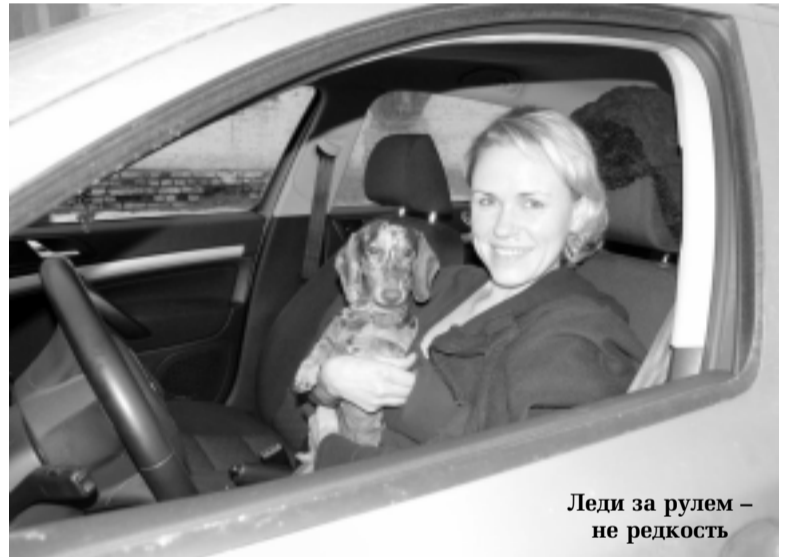
Леди за рулем – не редкость