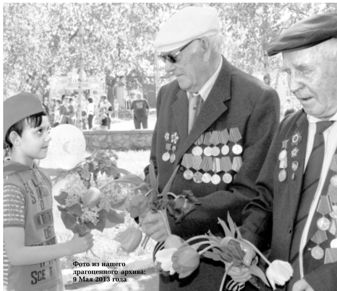
Фото из нашего драгоценного архива: 9 Мая 2013 года