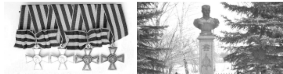
Символы забытой войны!