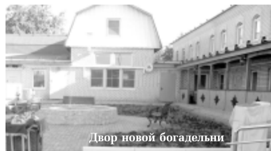
Двор новой богадельни