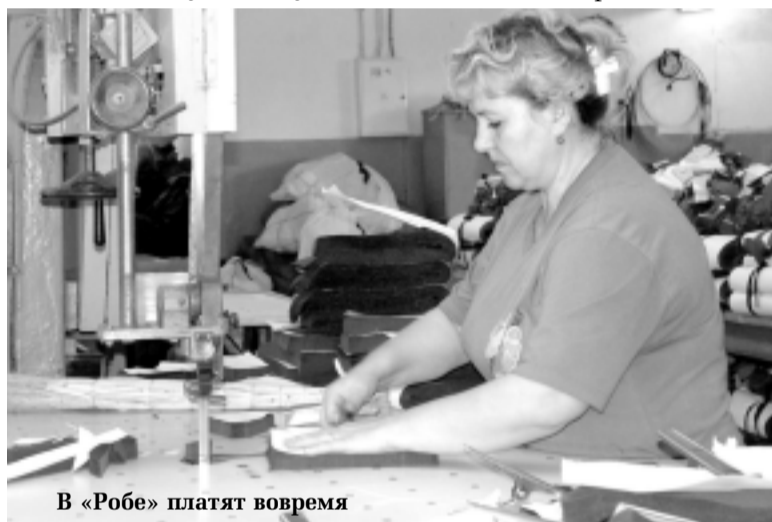
В «Робе» платят вовремя

Необходимо также отметить, что подобного рода нарушение законодательства о труде является основанием для привлечения работодателя к административной ответственности, предусмотренной частью 1 статьи 5.27 Кодекса об административных правонарушениях. Повторное нарушение трудового законодательства должностным лицом, ранее подвергнутому административному наказанию за аналогичное правонарушение, влечет дисквалификацию на срок от одного года до трех.