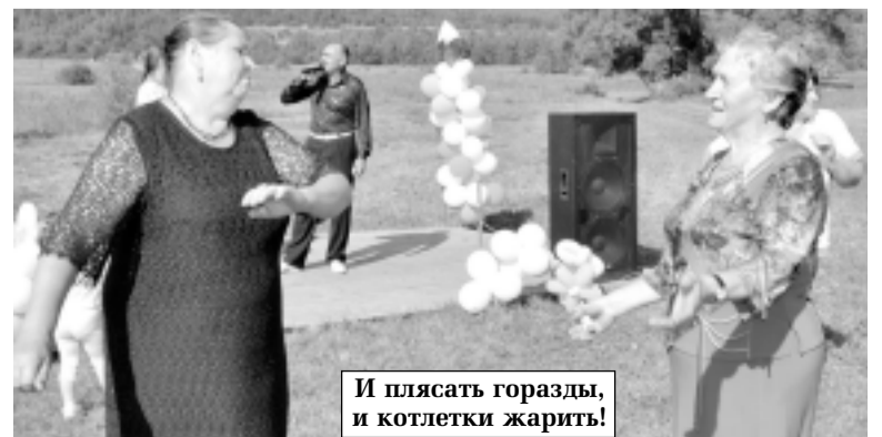
И плясать горазды, и котлетки жарить!