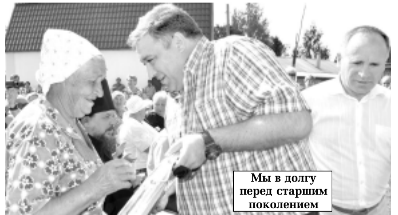
Мы в долгу перед старшим поколением