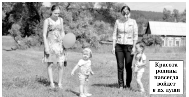
Красота родины навсегда войдет в их души