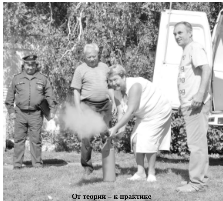
От теории – к практике